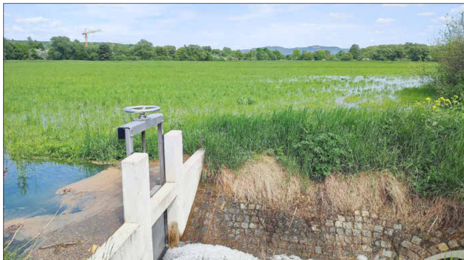
Aktive Wässerung nahe der Stadt Forchheim