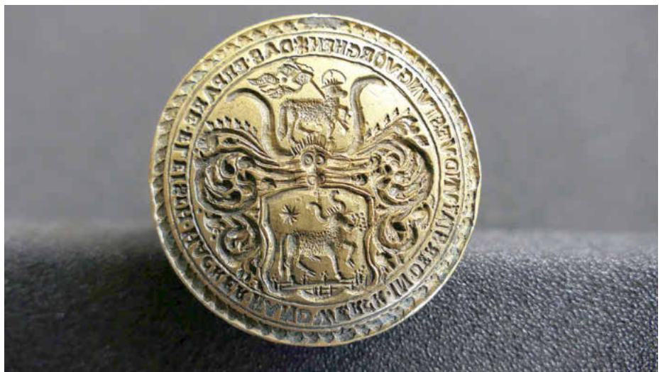
Siegelstempel-Unterseite der Metzgerzunft

Öffnungszeiten: Dienstag von 14 bis 16 Uhr und Donnerstag von 14 bis 17 Uhr. Bitte melden Sie sich vor Ihrem Besuch schriftlich oder telefonisch an: archiv@forchheim.de oder unter Tel.: 714-314.